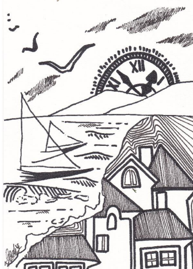
grafică de prof. Elena DODIȘ

Mă uit la anii mei grăbiți ce par jucați la o ruletă... Se duc așa de puștiți, iar sufletul îi tot regretă!