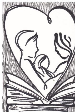
grafică de prof. Elena DODIȘ