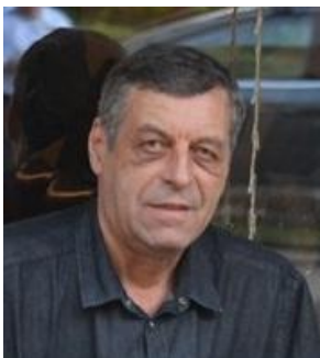
Prof. Dr. Const. MIU